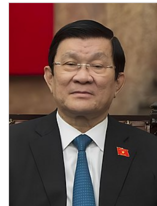
Chủ tịch nước Trương Tấn Sang