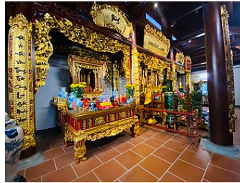
Một ban thờ Nhà thờ họ Trương Việt Nam

Trong sách kỷ lục Guinness xuất bản năm 1990, Họ Trương giành kỷ lục họ có nhiều người mang nhâ t trên thế giới, vượt hẳn các họ Lý và Vương . Đầu năm 2006, Học viện khoa học Trung Quốc xếp họ này là họ thông dụng thứ 3 tại quốc gia đông dân nhâ t này. Họ Trương được sử dụng từ cách đây trên 4.000 năm. [3]