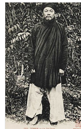
Lãnh tụ Hoàng Hoa Thám tức Trương Văn Nghĩa